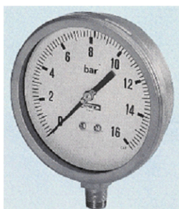
Manometro Bourdon inox