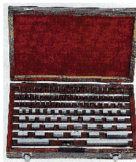
Blocchetti di riscontro pianparalleli